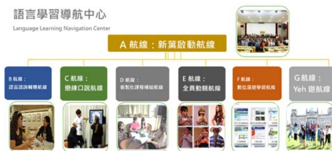
大葉大學語言學習導航系統圖