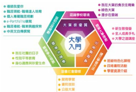
大葉大學大學入門課程活動設計圖

為協助大一新鮮人及早適應大學學習生活、充分體驗大學校園文化、並為學生應具備之核心能力培養奠定基礎，本校自 100 學年起新設「大學入門」課程(2學分)。此「大學入門」課程透過「大葉很優質」、「學習要多元」、「願景不是夢」之三大主軸學習活動，並結合大葉四肯書院與師徒導師，以創新、整合、活潑、成長之做法，培養大葉新鮮人學習四肯(肯學、肯做、肯付出、肯負責)的態度。「大學入門」課程之概念與設計，如右圖。茲將課程內容和執行績效說明如下：